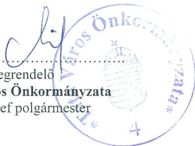
Megrendelő Tata Város Önkormányzata Michl József polgármester