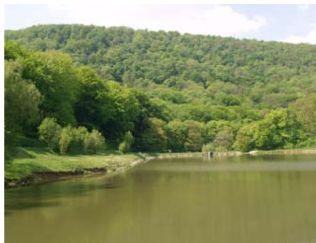
Képek a rendezvény helyszínéről

Tatai HVI: 2890 Tata Erzsébet királyné tér 13. Tel.: 06-30/742-76-97