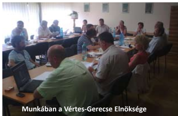
Munkában a Vértes-Gerecse Elnöksége

Legalább 4 település összefogásával a lakosság igényeihez igazodó tanfolyamok, előadássorozatok, szemináriumok