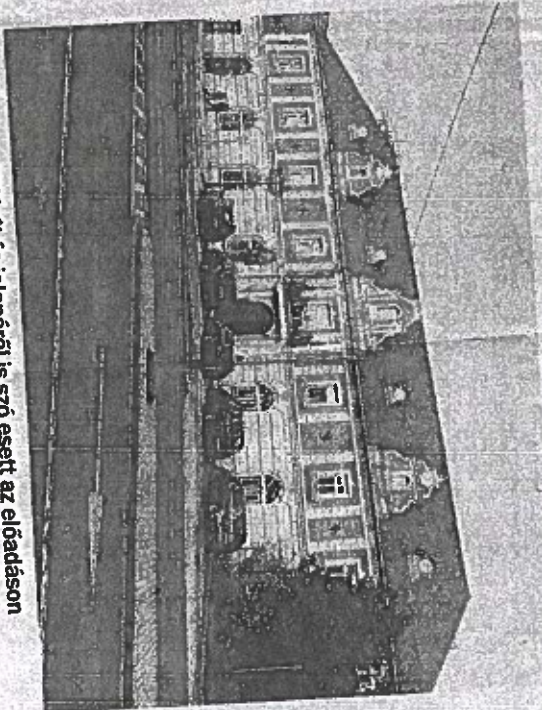
A szálloda múltjáról és jelenéről is szó esett az előadáson