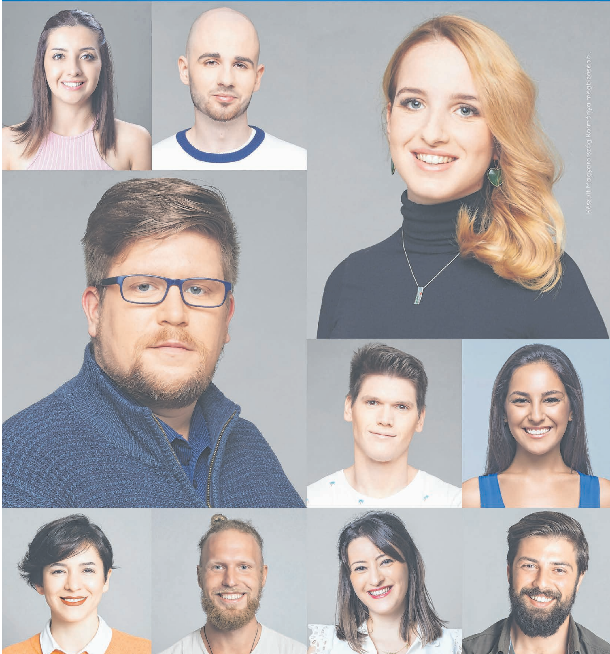
Készült Magyarország Kormányára megbízásból.