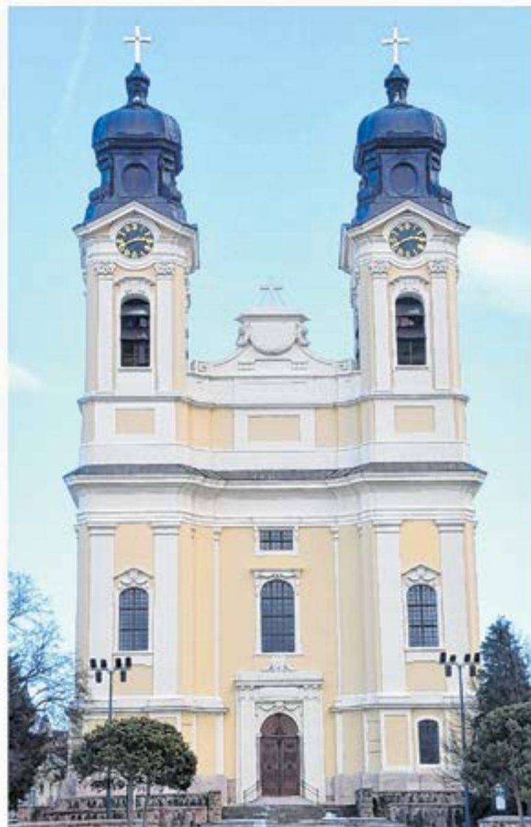
Az eredeti felő a Miklósi-templom szobrásza, szobrásza. Terebics Attila (Pestújság)

Fényképünk a jelenlegi, megújult állapotban ábrázolja a templom főhomlokzatát, de 10 kisebb-nagyobb részlet hiányzik róla. Karikázással jelölje ezeket a hiányosságokat!