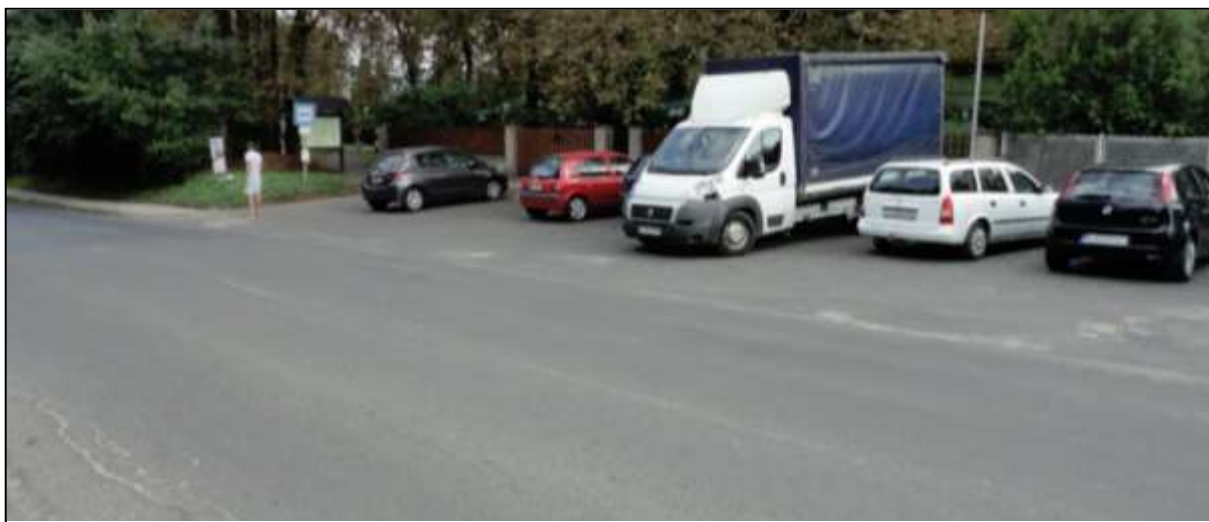
1. ábra: Jelenlegi állapot

A Tóvárosi vasútállomás mellett lévő parkoló kialakítása jelenleg nem rendezett. A járművek számára nincs kijelölt parkolóhely, így azok rendezetlenül, sokszor a maximális hely kihasználása nélkül parkolnak.