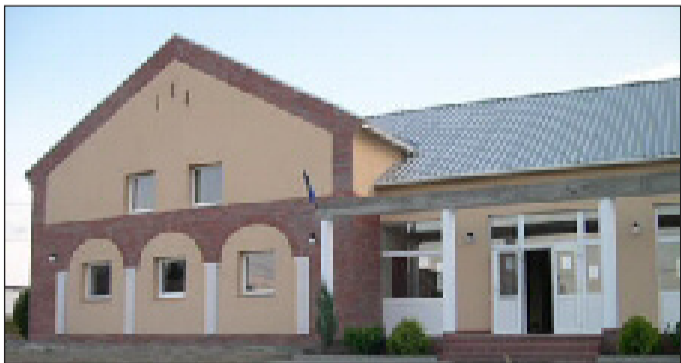
Naszályi Művelődési Központ

A kistérségi társulás éves költségvetésében meghatározott összegben támogatja a sajátos nevelési igényű, vagy a rész-képességi problémával küszködő általános iskolás gyermekek gyógypedagógiai, illetve fejlesztőpedagógiai foglalkozásait is. A Tatai kistérség minden általános iskolájában a 7. osztályos tanulók pályaválasztási tanácsadásban vesznek részt, amely segítséget nyújt számukra a megfelelő középfokú iskola kiválasztásában.