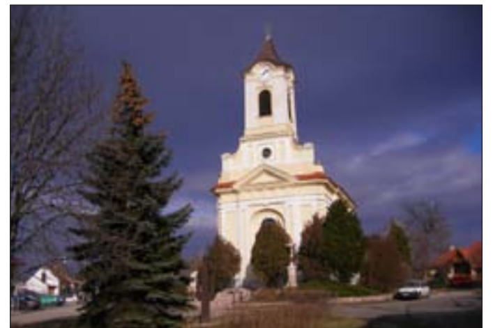
Baj - katolikus templom

2008-ban elkészült a kistérség egészségterve. A dokumentum a kistérség minden településére kiterjedően tartalmaz egészségügyi helyzetelemzést, a jelenlegi egészségügyi szervezet bemutatását, valamint ennek alapul vételével megfogalmazza a kistérség egészségfejlesztési és egészségügyi ellátás fejlesztési stratégiáját.