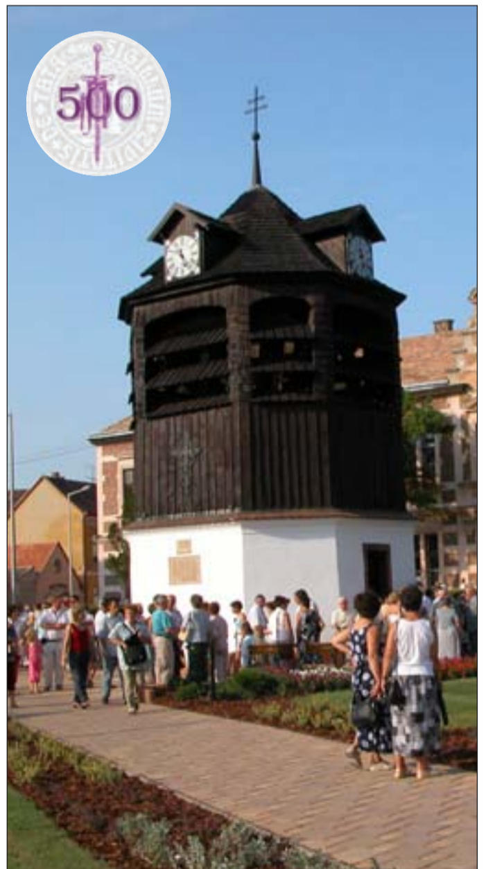
Tata - Harangláb

2008-tól a települési polgármesterek és a tatai rendőrkapitány részvételével Közbiztonsági Egyeztető Fórum működik a kistérségben. Ennek keretében a rendőrkapitány rendszeres tájékoztatást nyújt a kistérség közbiztonsági helyzetéről. A fórum egyben lehetőséget biztosít a problémák felvetésére és a közös megoldáskeresésre is.